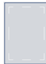
1/1 Seite randabfallend 210x297 mm + 3mm Beschnitt