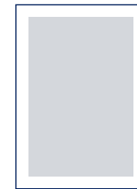
1/1 Seite Satzspiegel 180x252 mm